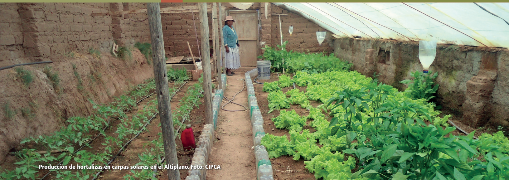
Producción de hortalizas en carpas solares en el Altiplano.