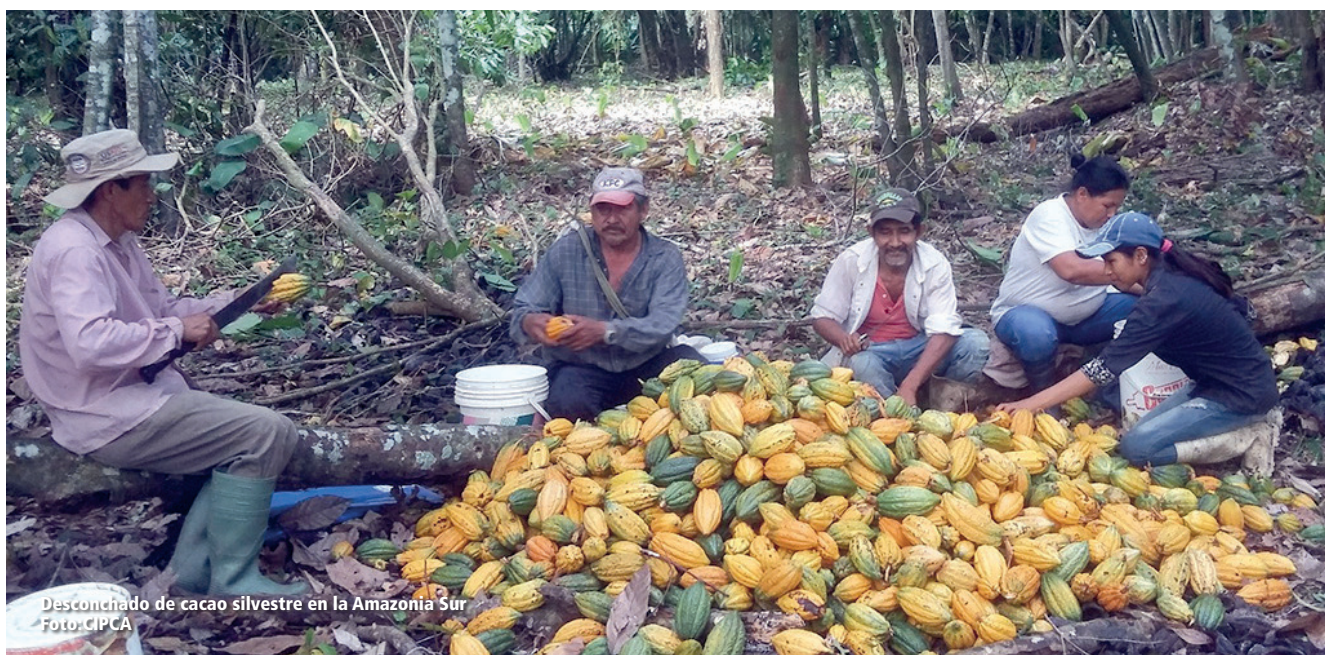
Desconchado de cacao silvestre en la Amazonia Sur

3. Recuperación de semillas tradicionales. La sostenibilidad del desarrollo agrícola depende de las semillas y es uno de los aspectos fundamentales para el futuro de la seguridad y soberanía alimentaria. Las semillas representan un componente fundamental de los alimentos, de las materias primas para la industria alimentaria, de la cultura indígena campesina,