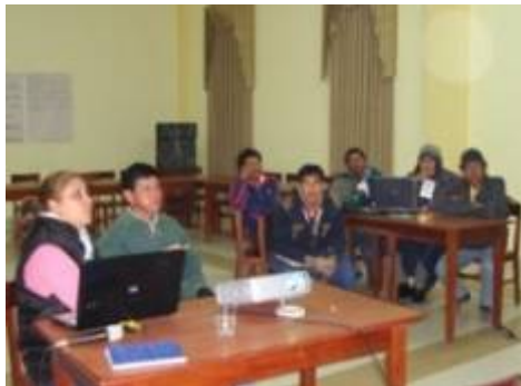
Abriendo correos electrónicos

Los y las participantes aprendieron a navegar en Internet, conocer los buscadores e buscar y encontrar información útil para el trabajo con sus organizaciones y comunidades.