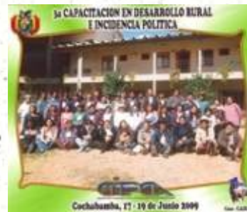
Cochabamba, 17 - 19 de Junio 2009 Participantes del Módulo I