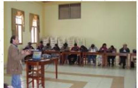
Diego Cuadros exponiendo

Fue una exposición que aclaró muchas dudas de los/as participantes.