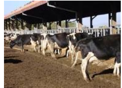
Vacas lecheras Holstein